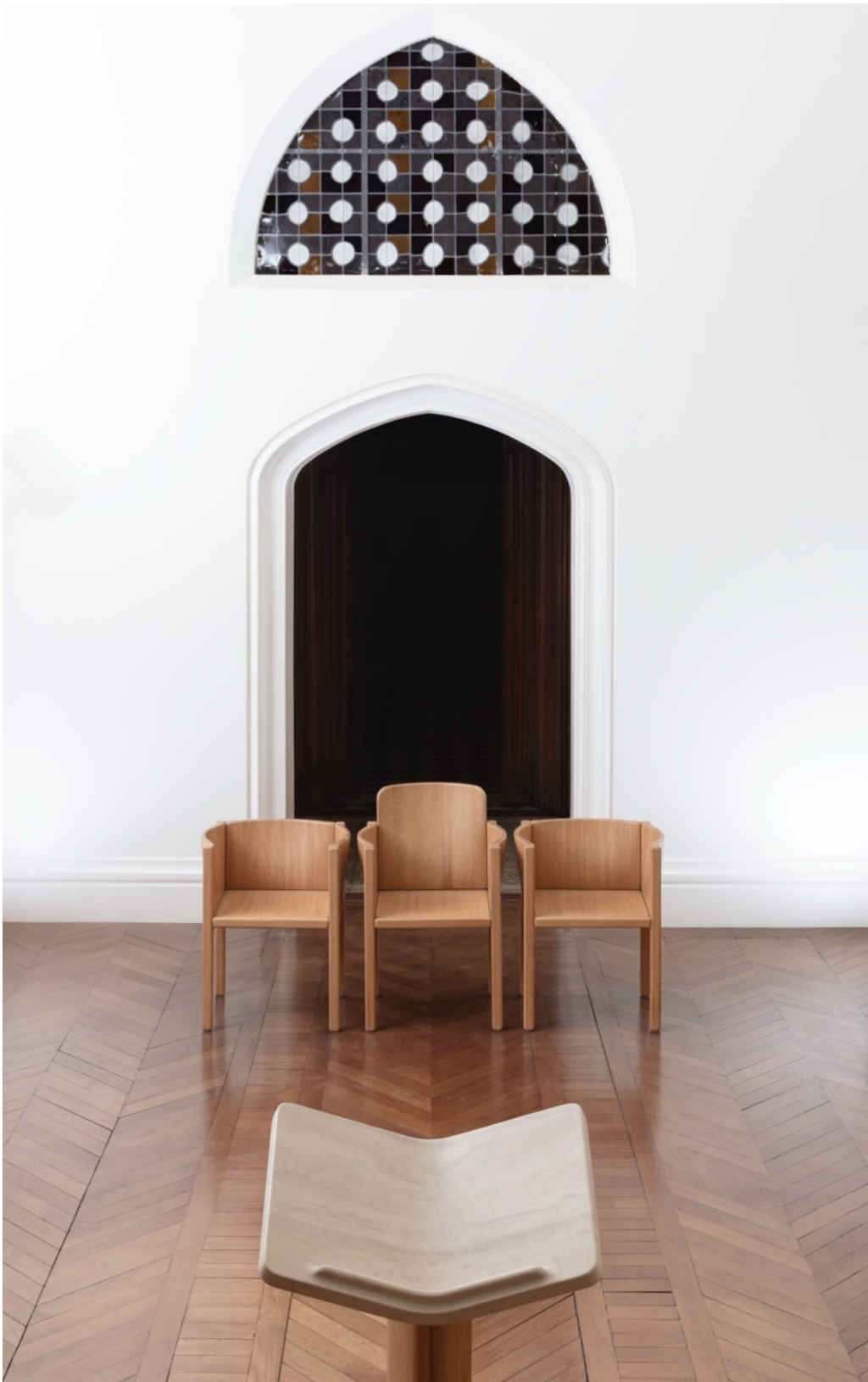
CHAISE NAVIS ET NAVIS +